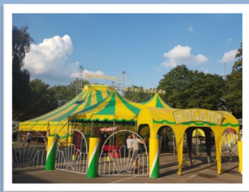
Alle 4 Jahre das Zirkusprojekt