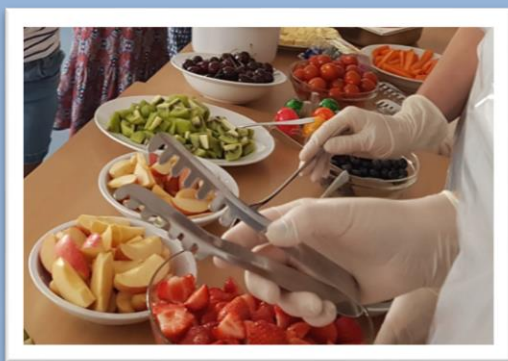
Zweimal im Jahr das Gesunde Frühstück